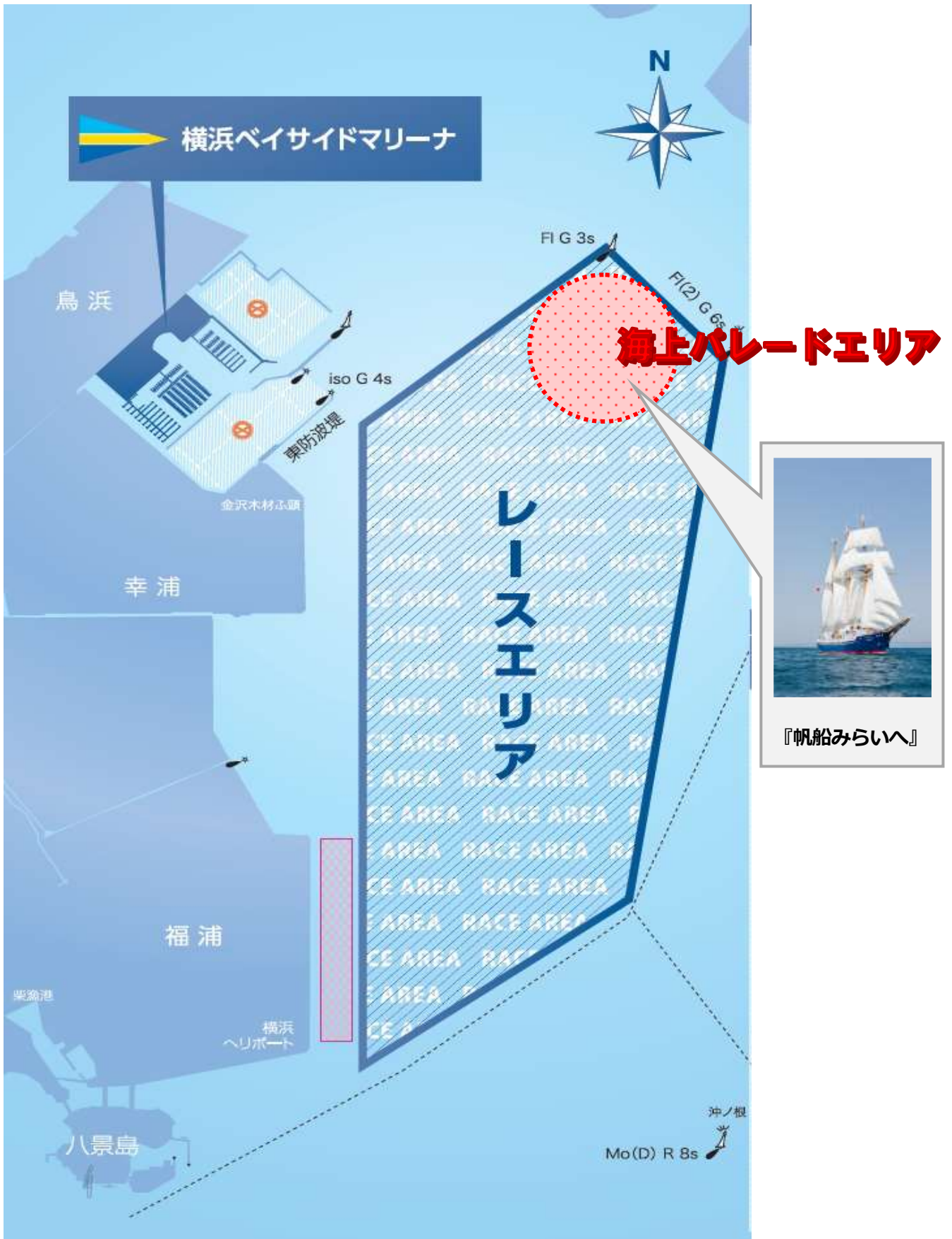
添付図1 「レース・エリア」